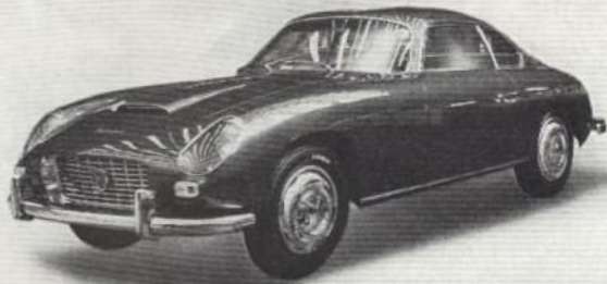
LANCIA FLAMINIA SPORT (ZAGATO)