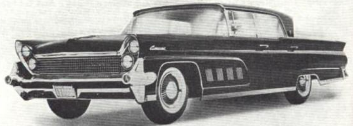
LINCOLN CONTINENTAL MARK IV LANDAU

Rapports de démultiplication: Multiplicat. max. par le convertisseur 2,1:1, démultipl. de la boîte planétaire 2,37:1, 1,48:1 et 1:1 AR 1,84:1.