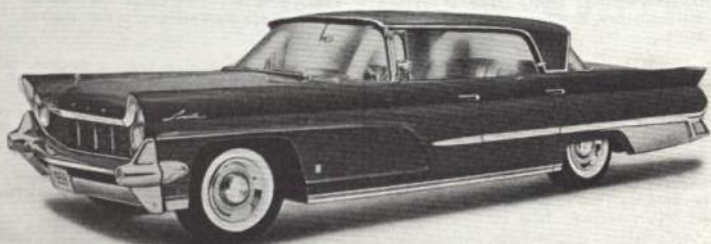
LINCOLN PREMIERE LANDAU

Modèle de luxe de la Ford Motor Co. Carrosserie autoporteuse. 1959: empattement plus long, modifications de détail à la carrosserie.