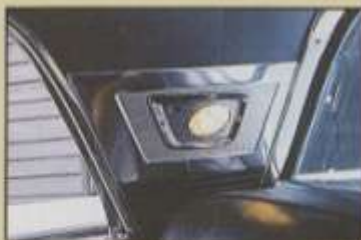
Der Lincoln verfügt sogar über Leseleuchten für die Fondpassagiere

Die Ford Mercury unterteilte die Modelle ihrer Lincoln Division in drei Serien: In der "günstigsten" Lincoln Series (ab 5.441 US$) waren ein 4-dr Sedan, 4-dr Hardtop Sedan und 2-dr Hardtop Coupe im Programm. Bereits hier verfügen die Fahrzeuge serienmäßig über Luxus-Features wie servounterstützte