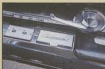
Liebvolle Detailarbeit: Aschenbecher mit Schriftzug und elektrische Fensterheber

Bremsen, Power Steering, Heizung und Defroster, Unterbodenschutz (I), Weißwandreifen, Uhr, Radio, Scheibenwaschanlage, ein gepolstertes Armaturenbrett, hintere Mittelarmlehne oder eine Doppelrohrauspuffanlage. Die nächstbessere Premiere Series (ab 5.945 US$) basiert auf den gleichen Karosseriearten wie