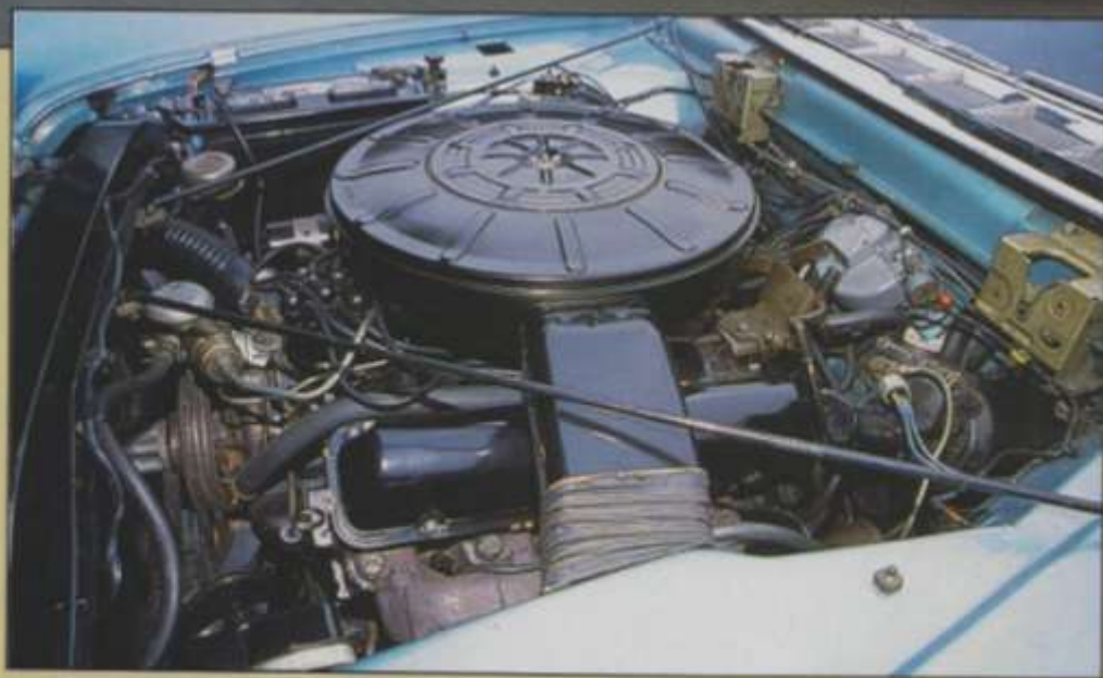
Der sieben Liter große Achtzylinder leistet 315 Pferdestärken

Dieser Continental Mark V hat in mehr als 40 Jahren lediglich 32.000 Meilen zurückgelegt