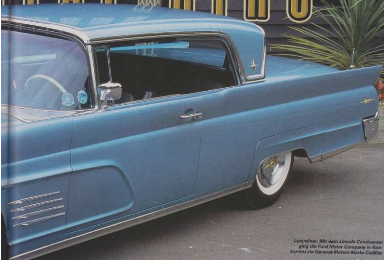
Luxusliner: Mit dem Lincoln Continental ging die Ford Motor Company in Konkurrenz zur General-Motors-Marke Cadillac